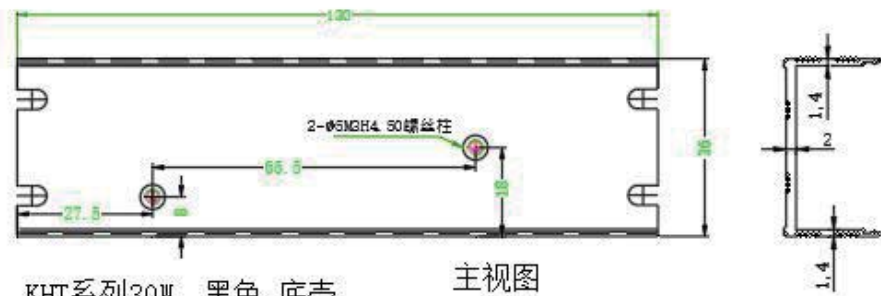
KHT系列30W 黑色 底壳